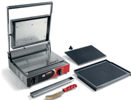
CORT RR PS TIMER