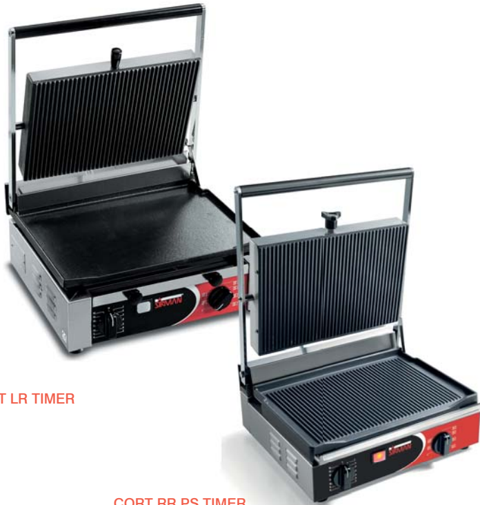
CORT LR TIMER