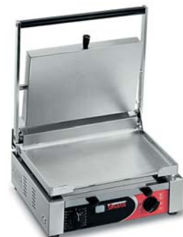
CORT XX TIMER