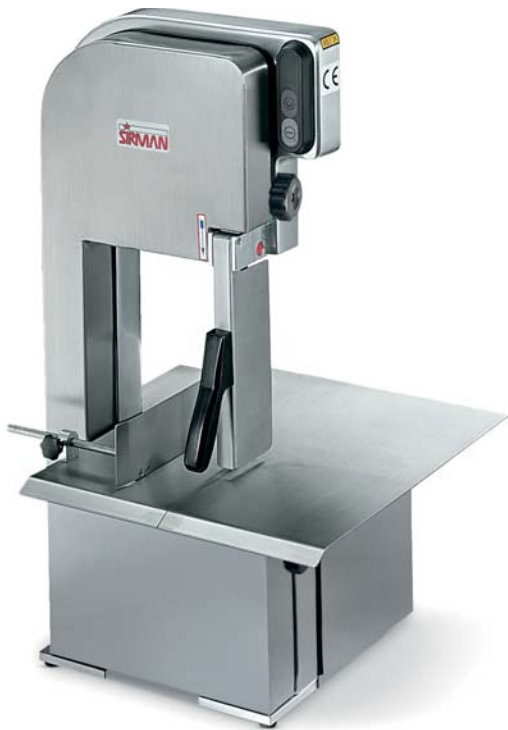
SO 1650 BREMEN