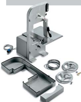
SO 1650 BREMEN