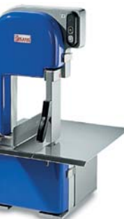
SO 1650 BREMEN BASIC